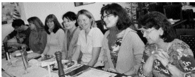
SeminarernehmerInnen 2004 in angeregtem Gespräch beim Mittagessen

Seminargebühr direkt an Referentin, siehe Anmeldeformular.